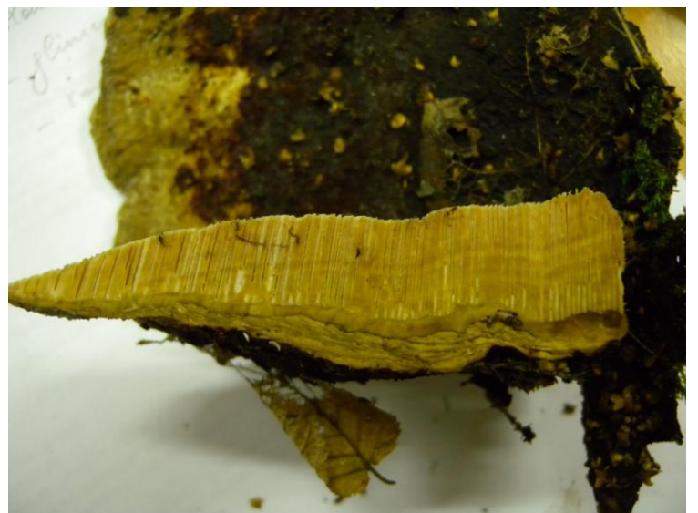
Dit zou de roodporiehoutzwam moeten zijn