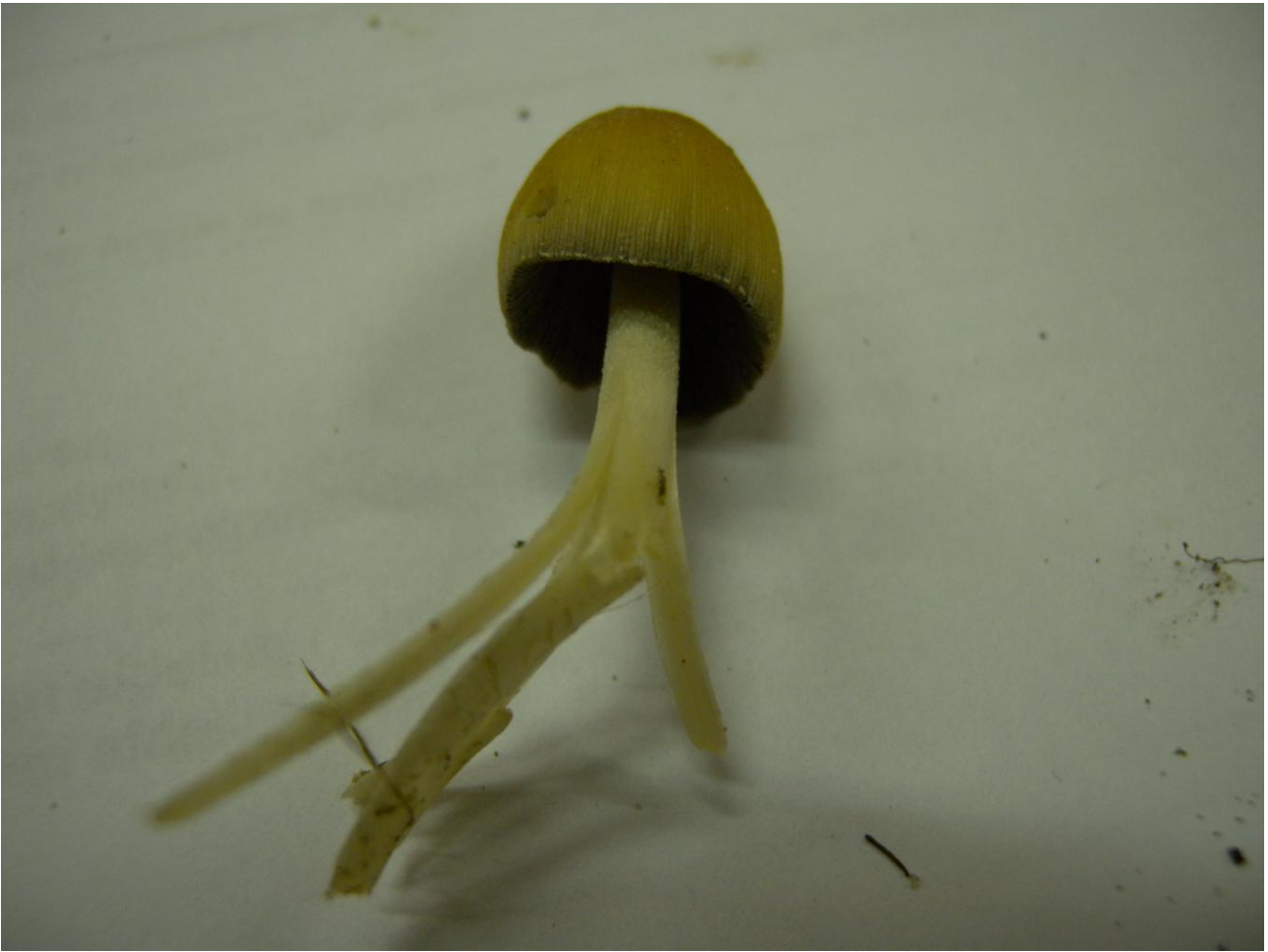
De glimmerinkzwam. Met de loupe zag je mooi de kleine witte korreltjes op de hoed.