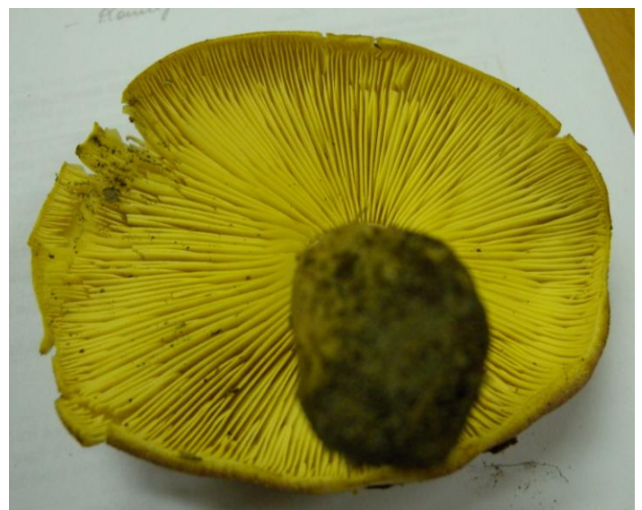
Dit is volgens ons de koningsmantel. Eetbaar maar geur en smaak muf!