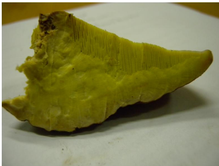
Deze citroengeel verkleurende jongen is volgens ons de roodgerande tonderzwam